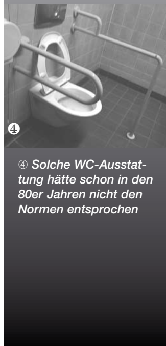
④ Solche WC-Ausstat- tung hätte schon in den 80er Jahren nicht den Normen entsprochen