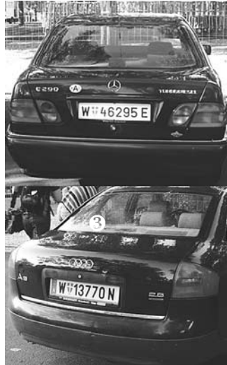
③ Polizisten-PKW's auf Rollstuhlparkplätzen, vom Ordner-Personal toleriert

Zitat aus einer präzisen Antwort des Bundesdenk- malamtes: „Wie sich die zuständige Landeskonser- vatorin erinnert, wurde die Behindertengerechtigkeit seitens der Architekten nicht eigens thematisiert, sodass sich das Bundesdenkmalamt sogar veranlasst sah, auf die Notwendigkeit der Akkordierung mit den Behindertenorganisationen hinzuweisen.“ ●